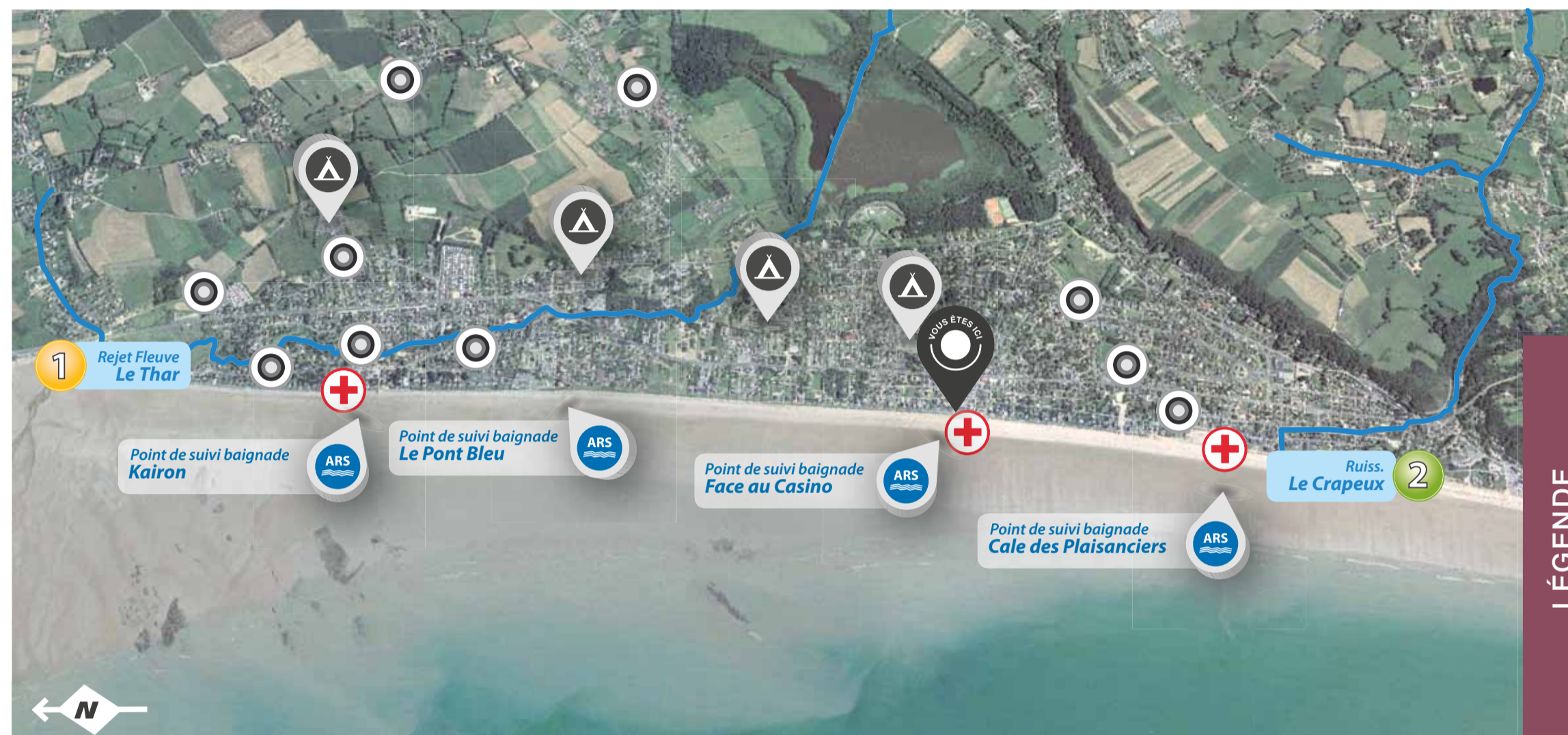
Fond de carte : ORTHO50-2007, Département de la Manche.