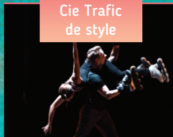
Cie Trafic de style

QUAI DE LA RÉGENTE // 15H00 JARDIN BOTANIQUE // 16H40