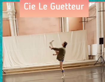
Cie Le Guetteur

KOAN / Création en cours / Spectacle en 2 parties / Durée : Extraits de 15 mn